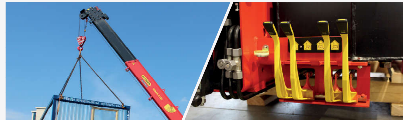
Максимальная грузоподъемность более 7 т Грузоподъемность увеличена на 450 кг