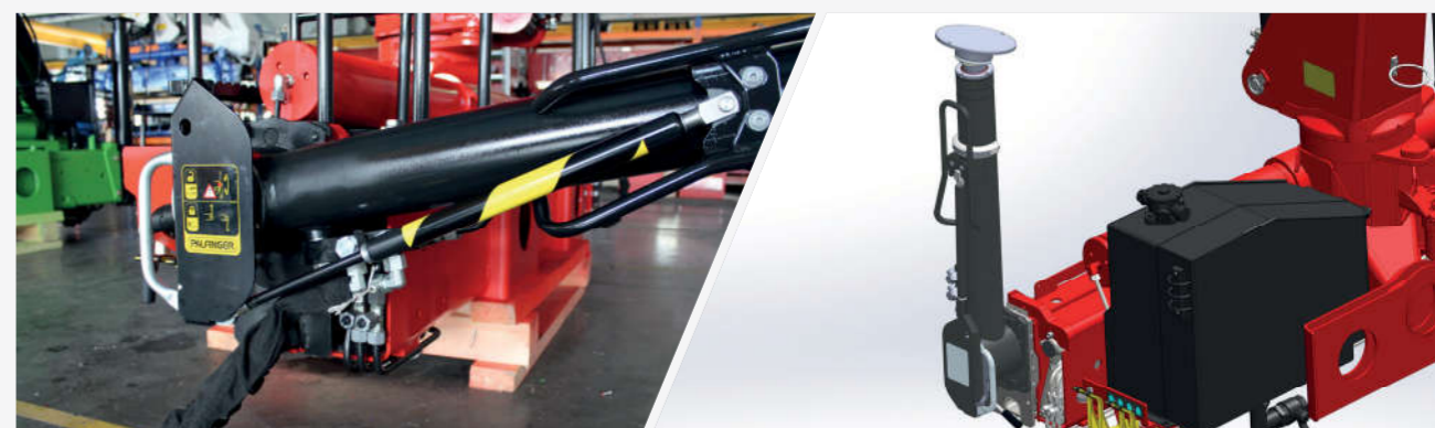
Опоры с ручным поворотом и пневмоцилиндрами Безопасность и удобство в процессе эксплуатации